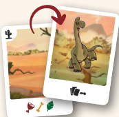
Безопасная территория / Эффект бабочки