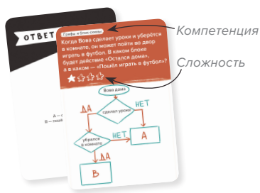
Рис. 1. Обозначения на картах.

Независимо от уровня подготовки игроков, рекомендуем начинать занятия с минимальной сложности: для старших детей они послужат хорошей разминкой и настроят на продуктивную работу.