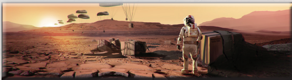
«Поставка снабжения» (Гарретт Каида)

Этот вариант игры можно использовать с любыми дополнениями. Теперь, вместо того, чтобы увеличивать глобальные параметры, ваша цель — повысить свой РТ до 63 за 14 поколений (или за 12, если вы играете с картами прологов). Пометьте 63-е деление золотым кубиком. В этом варианте игры добавляется новый стандартный проект «Буферный газ», который стоит 16 М€ и повышает ваш РТ на 1. В остальном действуют обычные правила игры в одиночку.